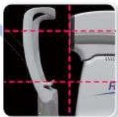
Modelo convencional a Topcon