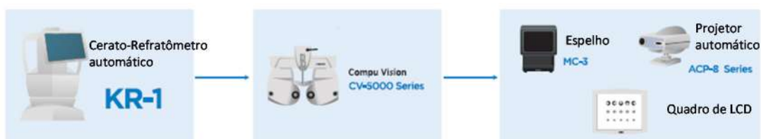
Diagrama do Sistema